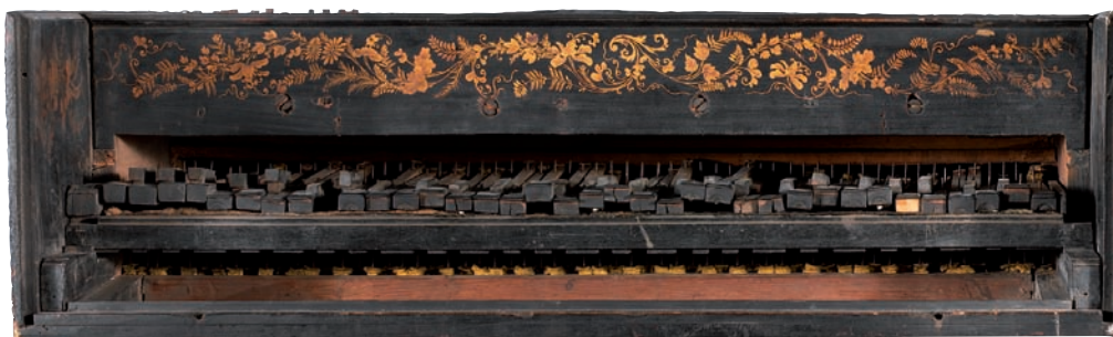
Clavier