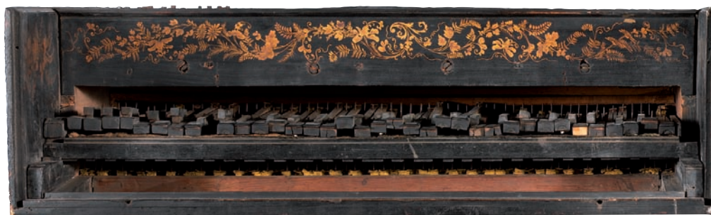
Clavier © Jean-Marc Anglès, 2009, musée d'Art et d'Industrie

Lucie Texier – chargée de communication 04 77 33 83 38 / lucie.texier@saint-etienne.fr Sylvain Bois – responsable du service des collections 04 77 33 20 31 / sylvain.bois@saint-etienne.fr